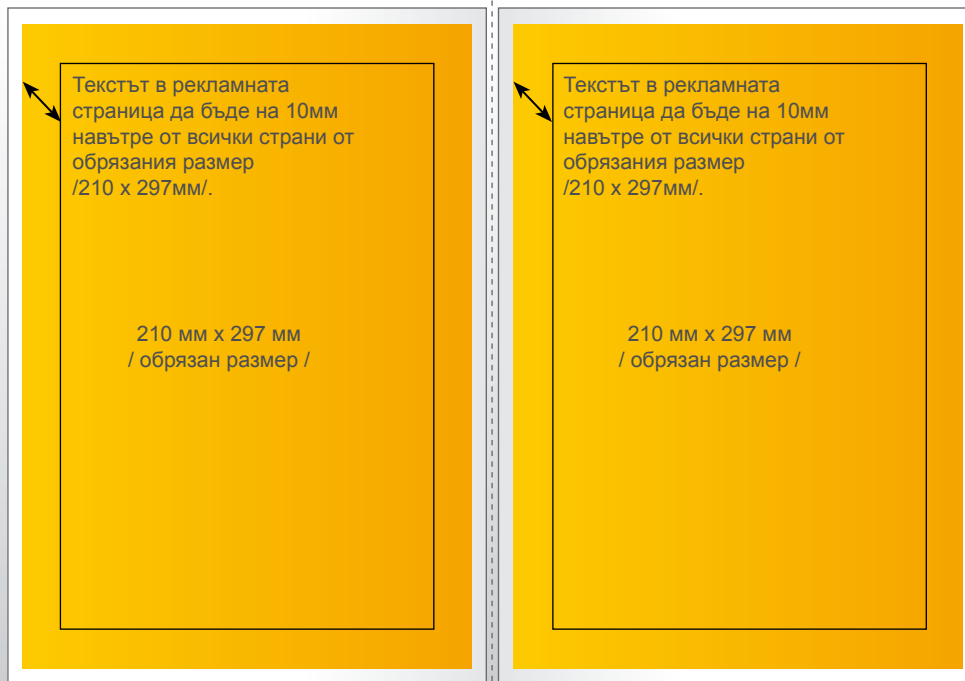
432 мм x 303 мм / не обрязан размер / 420 мм x 297 мм / обрязан размер /